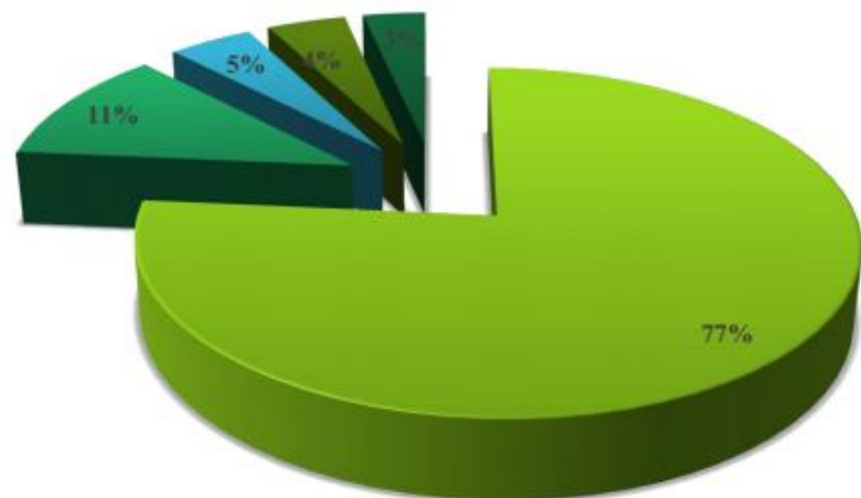
Κατανομή Κοινωνικής Αξίας